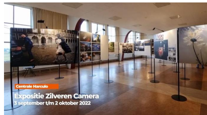
Impressie van de Expositie Zilveren Camera op locatie Centrale Harculo