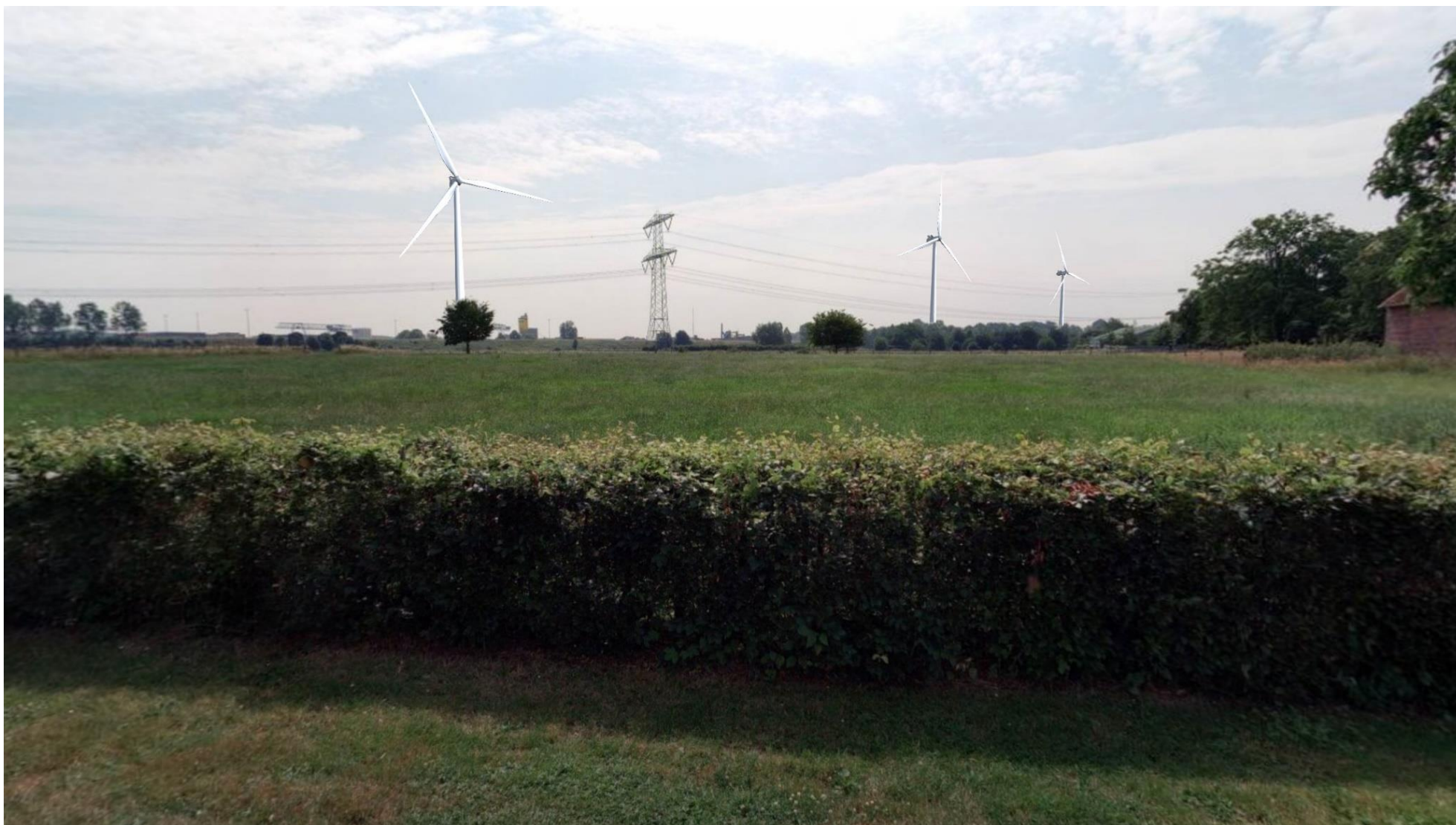
Afbeelding 7 Illikhoven (positie 5)