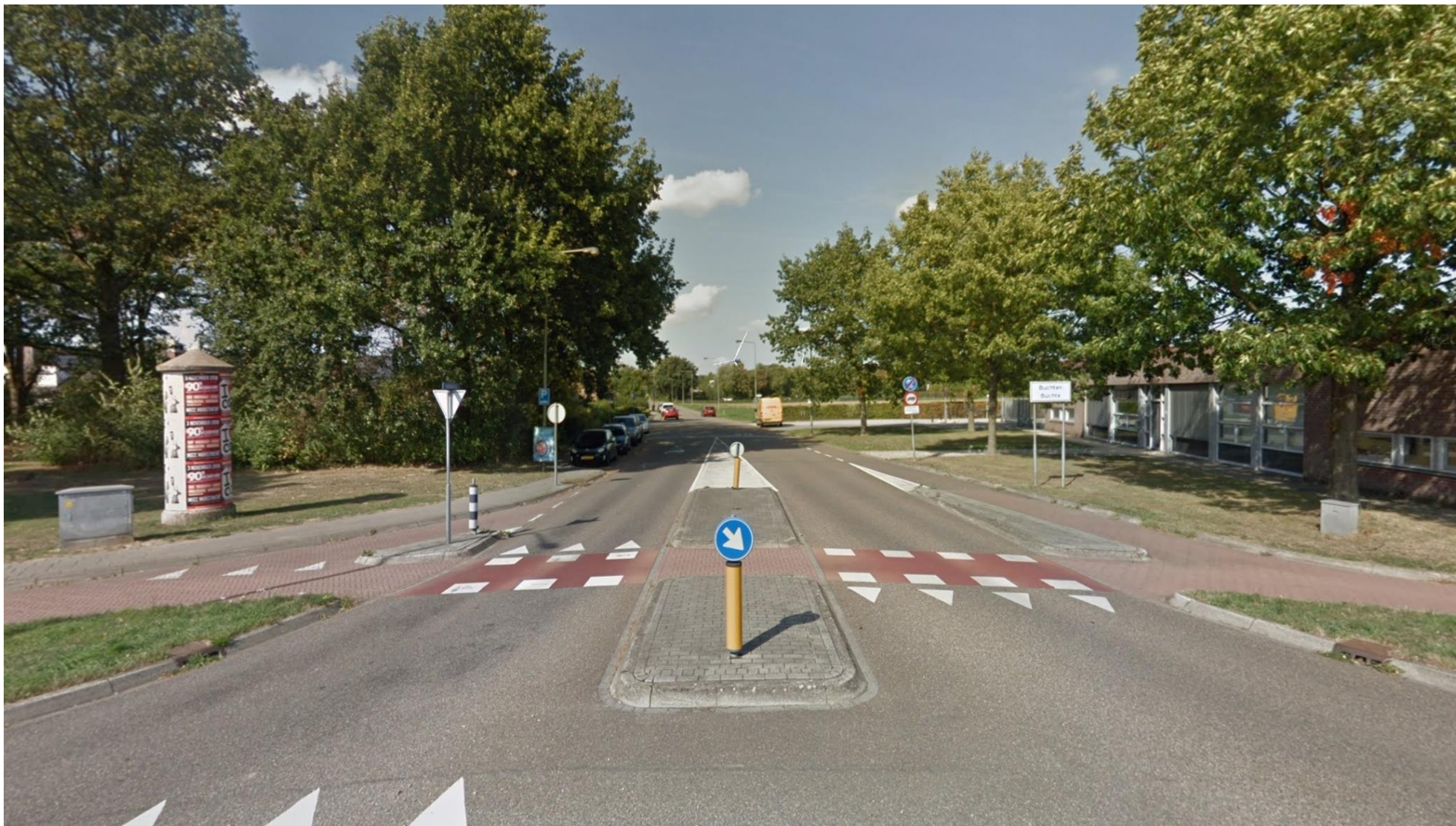
Afbeelding 11 Aldenhofweg Havenweg, Born (positie 8)