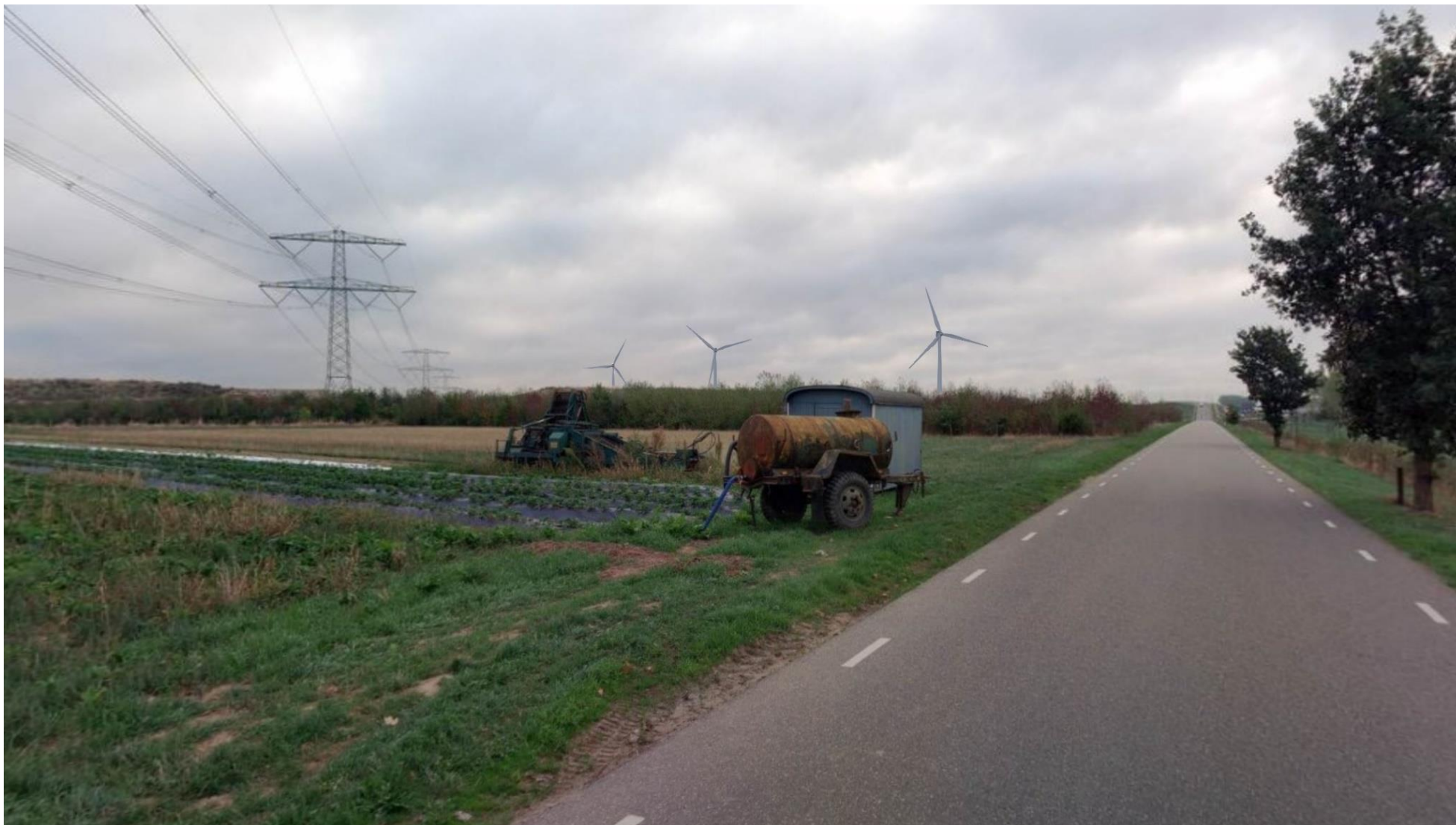
Afbeelding 4 Schipperskerk Parallelweg, Papenhoven (positie 3)