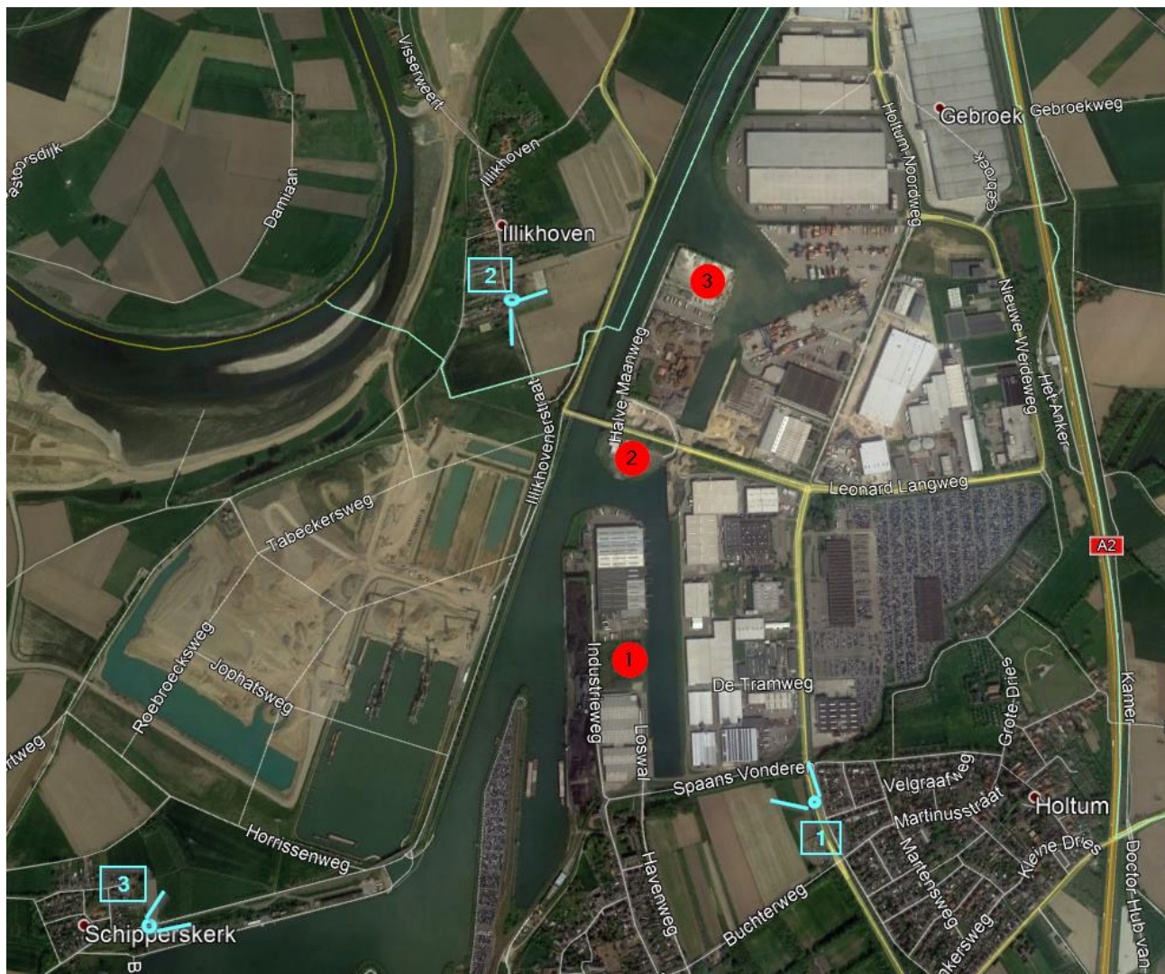
Afbeelding 1 Turbineposities en gezichtspunten 1 - 3