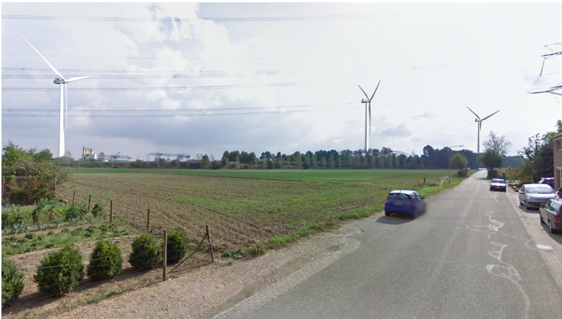
Afbeelding 3 Illikhoven, Roosteren (positie 2)