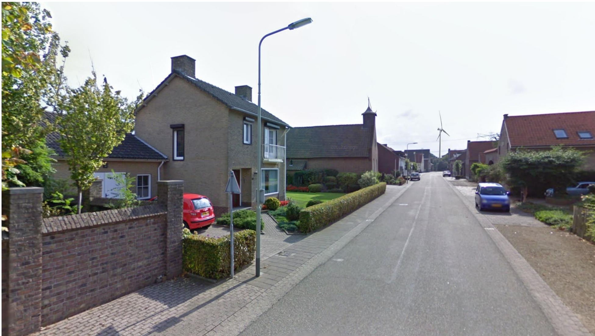
Afbeelding 6 Illikhoven (positie 4)