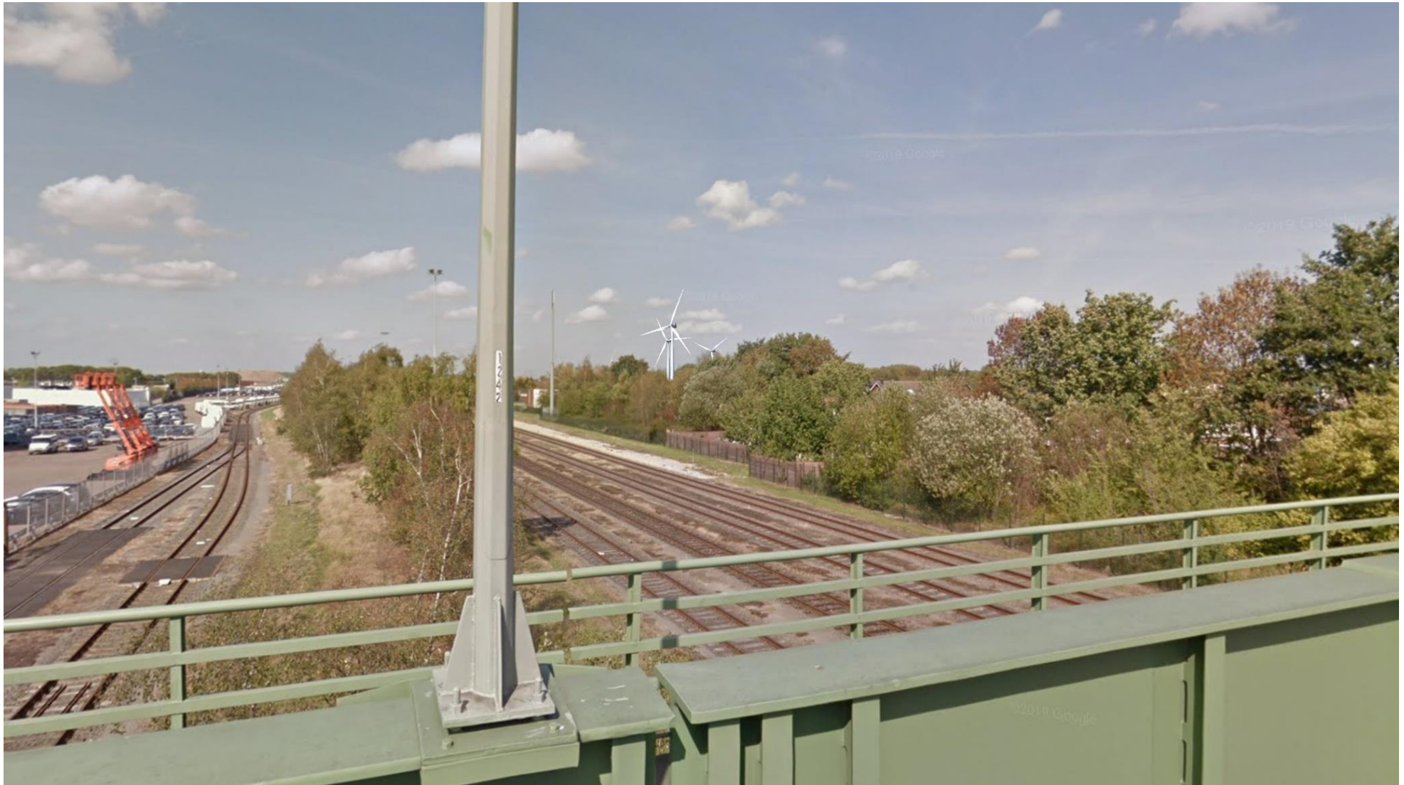
Afbeelding 12 Aldenhofweg spoor, Born (positie 9)