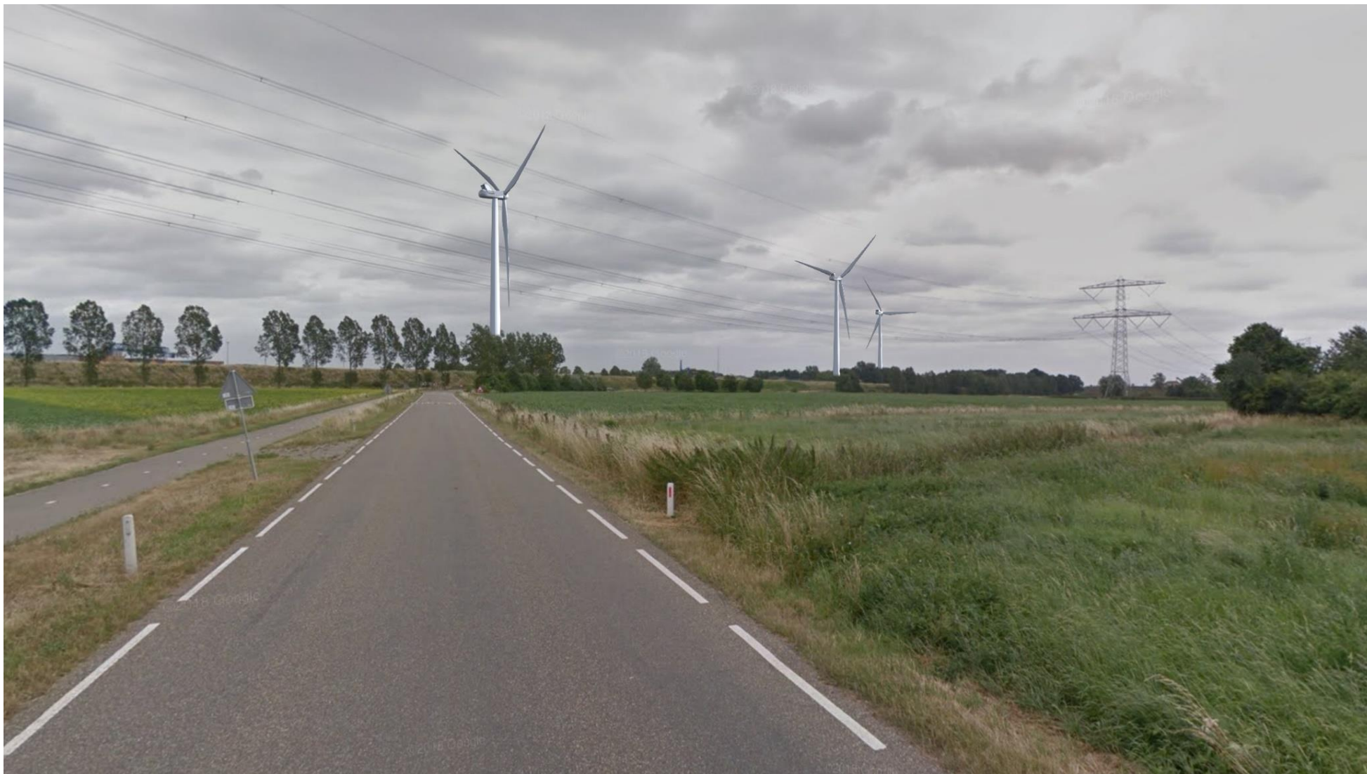
Afbeelding 8 Ruitersbaan (positie 6)