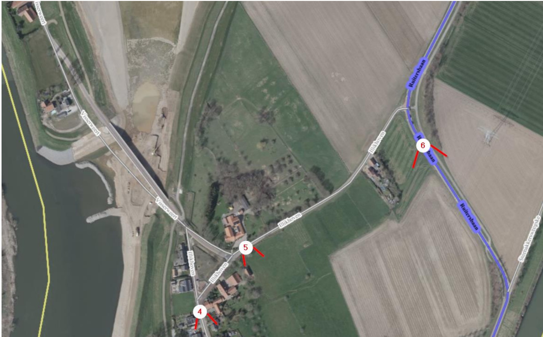
Afbeelding 5 overzicht gezichtspunten 4 - 6