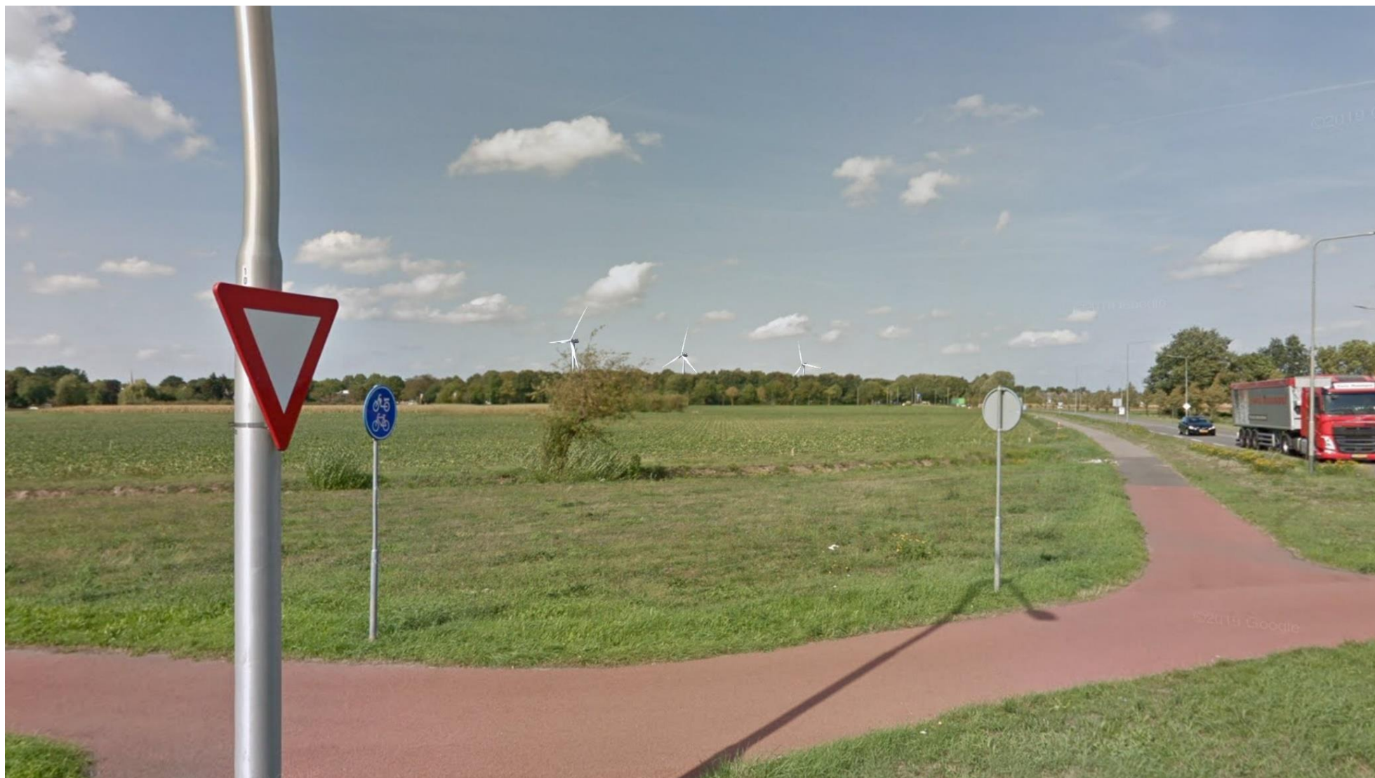
Afbeelding 10 Aldenhofweg, Born (positie 7)