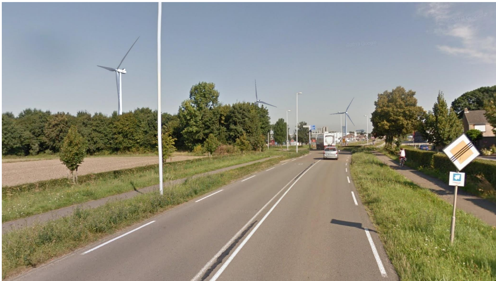
Afbeelding 2 Holtum (positie 1)