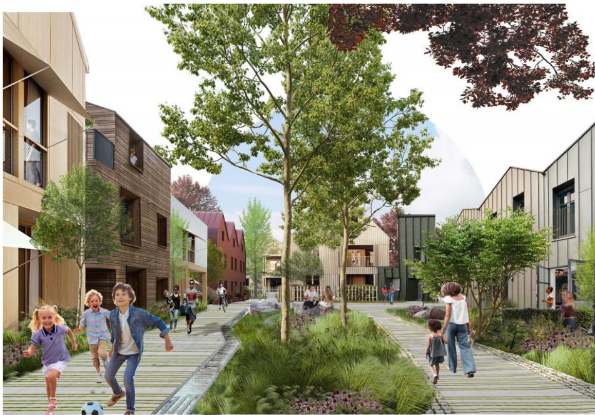
Sfeerbeeld 'Wonen Tussen de dijken'

In onze nieuwsbrief van december 2022 keken we terug op het voorbije jaar en keken we vooruit naar wat er in 2023 zoal op de agenda staat. Inmiddels zijn we een aantal maanden verder. Naast de zorgvuldige stappen die we zetten in de herontwikkeling van het terrein, staan er voor de komende maanden ook de nodige activiteiten op de agenda waar we u graag van op de hoogte brengen. We wensen u een mooie zomer op Harculo.